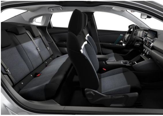
AMBIENTE SERIE "MEANWHILE" SCHWARZ