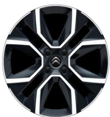
18-Zoll-Leichtmetallfelgen „CROSSLIGHT“ glanzgedreht