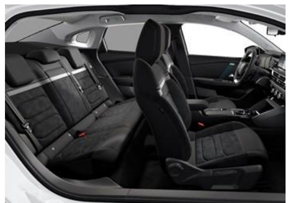
AMBIENTE ALCANTARA GREY