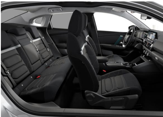
AMBIENTE METROPOLITAN GREY