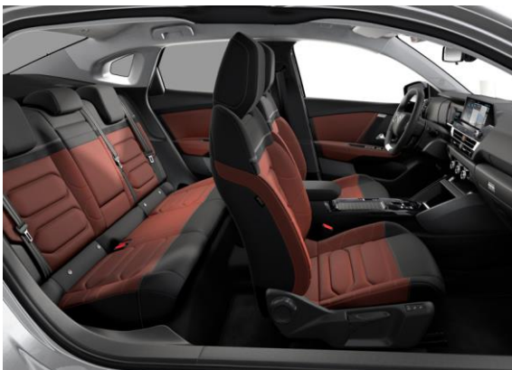
AMBIENTE HYPE RED