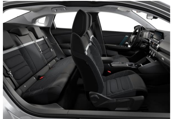
AMBIENTE URABN GREY