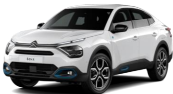
COLOR-PAKET "Anodised Blue"

- Airbump® und Nebelscheinwerfer mit blauer Dekorurandung