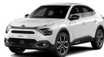
COLOR-PAKET "Glossy Silver"

- Airbump® und Nebelscheinwerfer mit schwarzer Dekorurandung