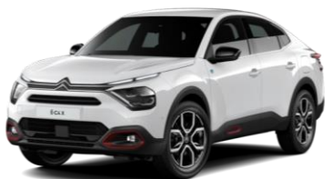
COLOR-PAKET "Anodised Deep Red"

- Airbump® und Nebelscheinwerfer mit grauer Dekorurandung