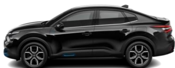
PERLA NERA-SCHWARZ (M)