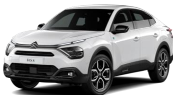
COLOR-PAKET "Glossy Black"

- Airbump® und Nebelscheinwerfer mit blauer Dekorurandung